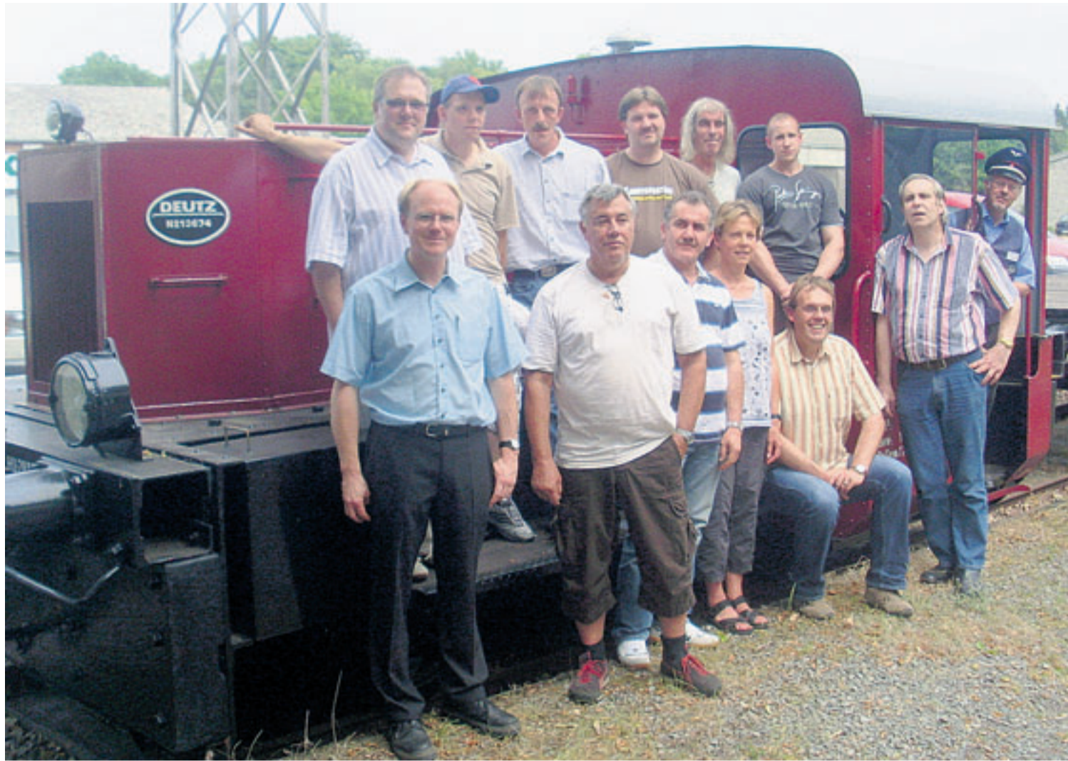
Verantwortliche und Beschäftigte des Projekts „Restaurierung historischer Eisenbahnwagen“ feierten gestern gemeinsam den Abschluss.

Den ersten Waggon, den sich Machlitt und seine Arbeiter vornahm, war ein Niederbordwagen. Für die Renovierung musste der Waggon – wie alle anderen auch – in seine Einzelteile zerlegt und anschließend wieder zusammengebaut werden, bevor er zum Abschluss einen neuen Anstrich erhielt. Jetzt, vier Jahre später,